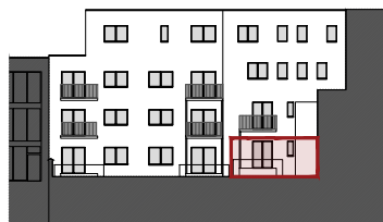
ACHTERGEVEL DE CONINCKSTRAAT