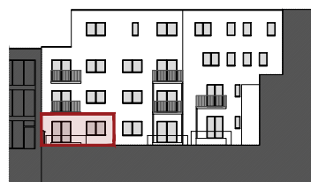
ACHTERGEVEL DE CONINCKSTRAAT