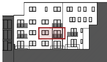
ACHTERGEVEL DE CONINCKSTRAAT