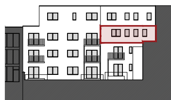
ACHTERGEVEL DE CONINCKSTRAAT