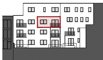
ACHTERGEVEL DE CONINCKSTRAAT