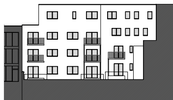
ACHTERGEVEL DE CONINCKSTRAAT