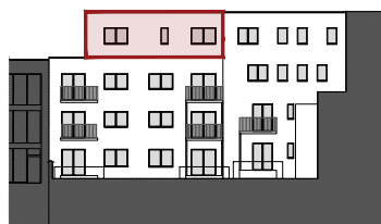
ACHTERGEVEL DE CONINCKSTRAAT